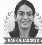
RANK 5, IAS 2023 RUHANI